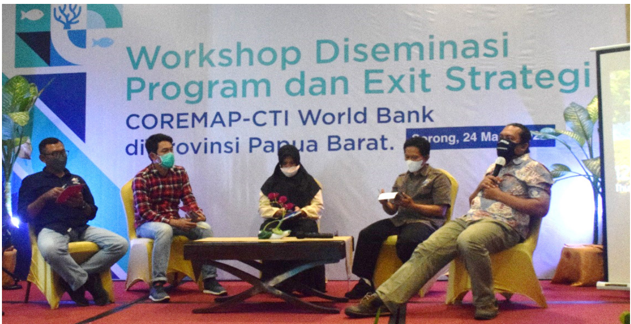
Para mitra pelaksana COREMAP-CTI WB, Papua Barat, tengah membagikan pengalaman, pembelajaran, capaian, bahkan rekomendasi bagi keberlanjutan program ini.

Bersinergi dengan yang dilakukan oleh Reef Check, PILI, PKSPL, Yayasan Terangi (Yayasan Terumbu Karang Indonesia) juga fokus untuk pengembangan ekowisata bahari dan pembangunan rendah karbon sebagai bentuk pemanfaatan Kawasan Konservasi Perairan oleh masyarakat di Raja Ampat. Beberapa capaiannya antara lain telah dilakukan peningkatan kapasitas terhadap para pemandu wisata lokal yang tergabung dalam Pokdarwis (Kelompok Sadar Wisata), dan Pokmaswas (Kelompok Masyarakat Pengawas) dalam sertifikasi yang diakui oleh pemangku kebijakana. Terangi juga berhasil memetakan 15 lokasi penyelaman di lima lokasi Suaka Alam Perairan (SAP) di Waigeo sebelah barat dan 10 lokasi di KPPD Misool. Terangi juga melakukan pelatihan dan sertifikasi dalam perencanaan pengelolaan kawasan konservasi Mereka juga memastikan masyarakat lokal terlatih sebagai pemandu wisata bahari yang juga dibekali ketrampilan dalam melakukan pertolongan pertama pada kecelakaan di perairan.