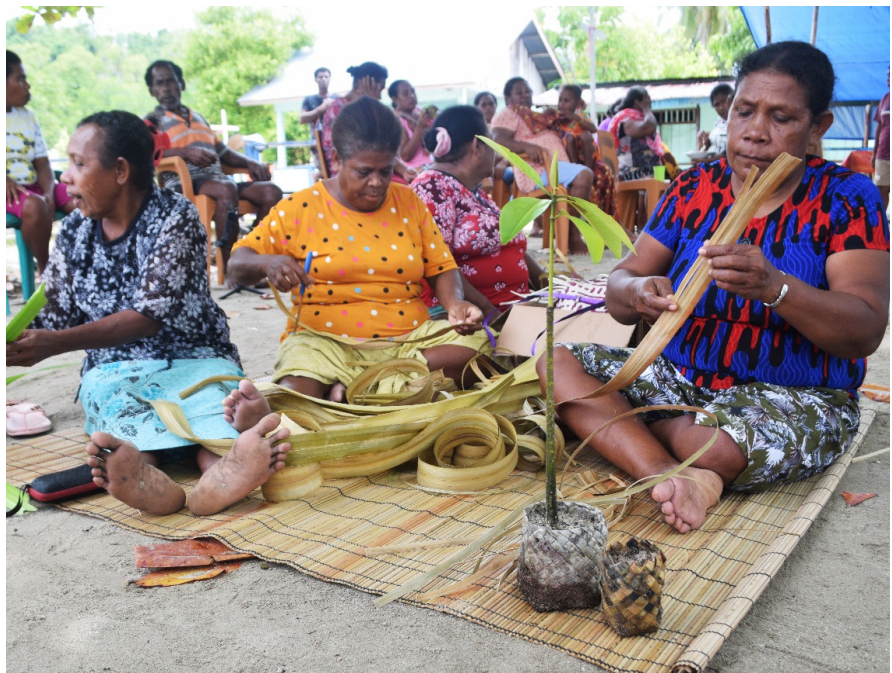
Kelompok Mama di Raja Ampat Yensawai, Raja Ampat, Papua Barat, juga menjadi terdepan dalam kelestarian mangrove di sana.

Tentu saja kelestarian dan kearifan lokal tidak akan berjalan dengan baik jika masyarakat tidak berdaya secara ekonomi. Hal ini pernah ditegaskan oleh Direktur ICCTF, Tonny Wagey. Bicara konservasi tanpa kesejahteraan masyarakat sangat mustahil. Karena itu meski sangat kecil dan sederhana, namun program COREMAP-CTI juga memberikan pelatihan dan meningkatkan kapasitas agar masyarakat bisa meningkatkan mata pencahariannya. Contohnya di Mutus, diakui beberapa kelompok masyarakat di sana sangat membantu, bahkan pada saat masa pandemik seperti ini.