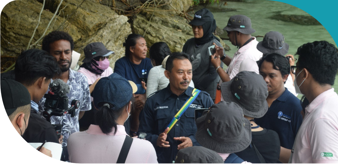
Para jurnalis dari Jakarta dan Sorong antusias mewawancarai sejumlah narasumber di lapangan. Praktek baik dan juga cerita inspiratif menjadi minat mereka dalam kegiatan Media Visit Penutupan Program COREMAP-CTI WB di Papua Barat ini.