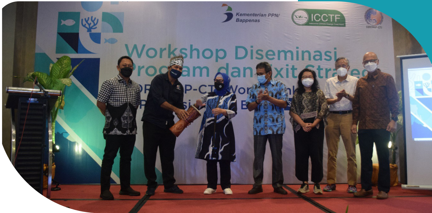
Sri Yanti JS, Direktur Kelautan dan Perikanan Kementerian PPN/Bappenas (memakai jilbab biru), membuka kegiatan Workshop Diseminasi Program dan Exit Strategy, yang dilakukan di Sorong, pada 24 Maret 2022 lalu.