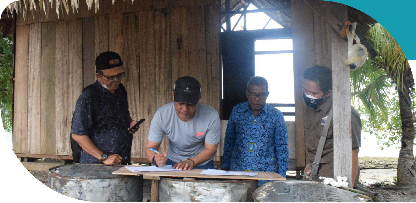
Setelah Tim Aset memastikan semua alat dan bangunan yang akan diserahkan ke pemangku kebijakan atau masyarakat setempat telah di cek dan kondisinya baik, dilakukan penandatanganan Berita Acaranya.